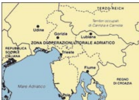
La Zona di Operazioni Litorale Adriatico dopo l'8 settembre 1943.