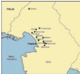
Le principali foibe della zona di Trieste e Gorizia.