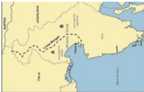
Il confine orientale e la divisione in zona A e zona B nel giugno 1945.