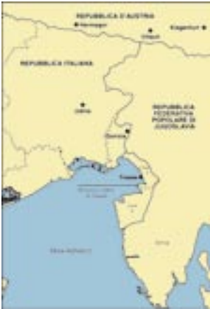
Il confine orientale dopo il trattato di pace di Parigi.