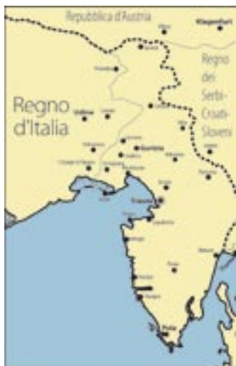
Confine del 1915.