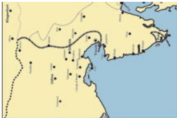
Il confine orientale il 9 giugno 1945.