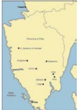
Le foibe nella penisola istriana.